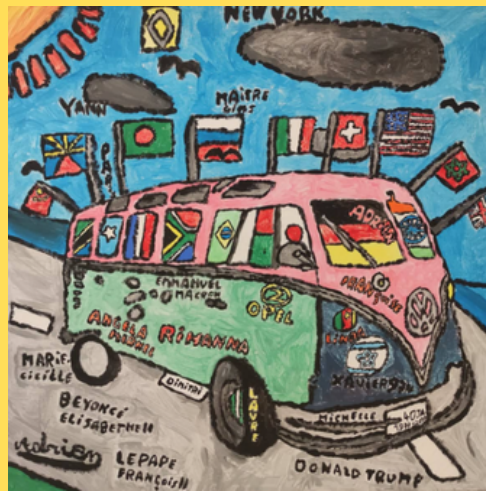
Peinture réalisée par Adrien, Jeune avec TSA